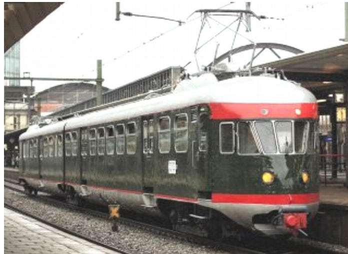
Een trein als deze werd beschoten. (In oorlogstijd waren ze helemaal in een bruin/groene kleur schutkleur gespoten)

Ik herinner mij niet of er bij die actie nog doden zijn gevallen er waren wel wat gewonden.