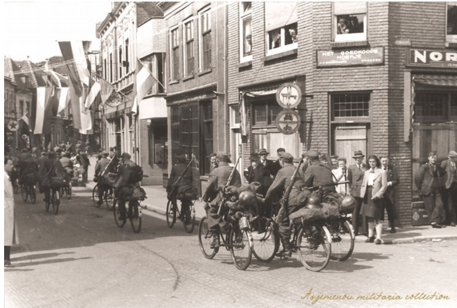
Colonne fietsende Duitsers in Woerden

In de bezette gebieden maakten de Duitsers veel gebruik van fietsen, de militaire productie in Duitsland was meer gericht op tanks, kanonnen en gevechtswagens dan op vervoer.