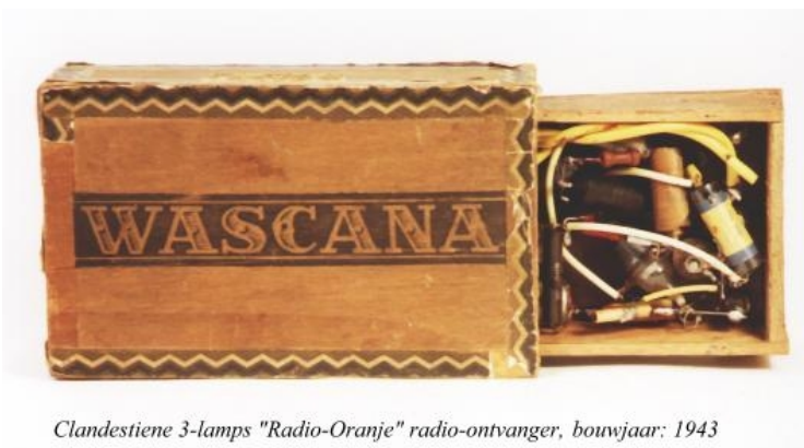
Clandestiene 3-lamps "Radio-Oranje" radio-ontvanger, bouwjaar: 1943

Radio amateurs bouwden zelf kleine ontvangers in een sigarenkistje o.d., die waren gemakkelijk te verbergen.