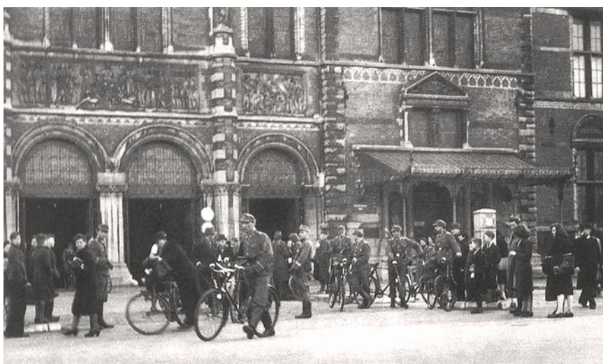
Fietsenrazzia in Amsterdam

Ze konden ook niet omkeren want net om de hoek stond een gewapende soldaat die de terugtocht belemmerde.