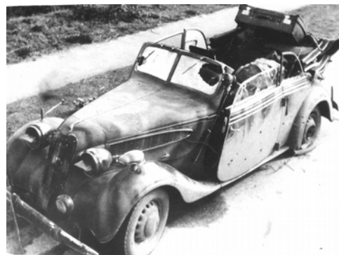
De auto na de aanslag

En zo zijn er nog talloze voorbeelden te noemen.