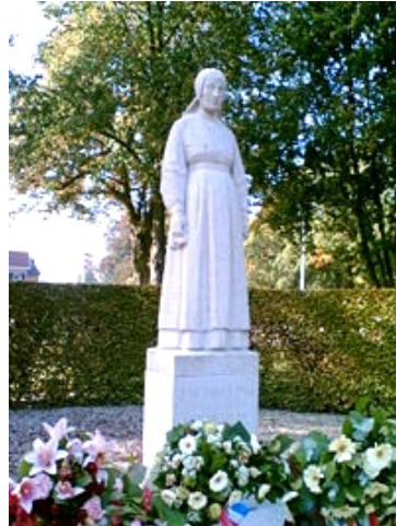
Monument voor slachtoffers.

Hetzelfde gebeurde na een aanslag op 6 maart 1945 bij de Woeste Hoeve, dichtbij Apeldoorn, daar probeerde de ondergrondse een Duitse auto te bemachtigen, in die auto zat toevallig? de SS-generaal Hanns Rauter die zwaar gewond werd, maar de aanslag wel overleefde.