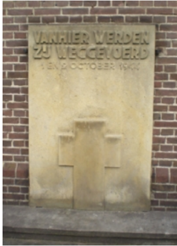
Herinneringssteen bij Ned. Herv. Kerk Putten