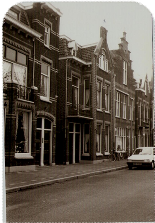
Woonhuis Binnensingel 29 te Vlaardingen