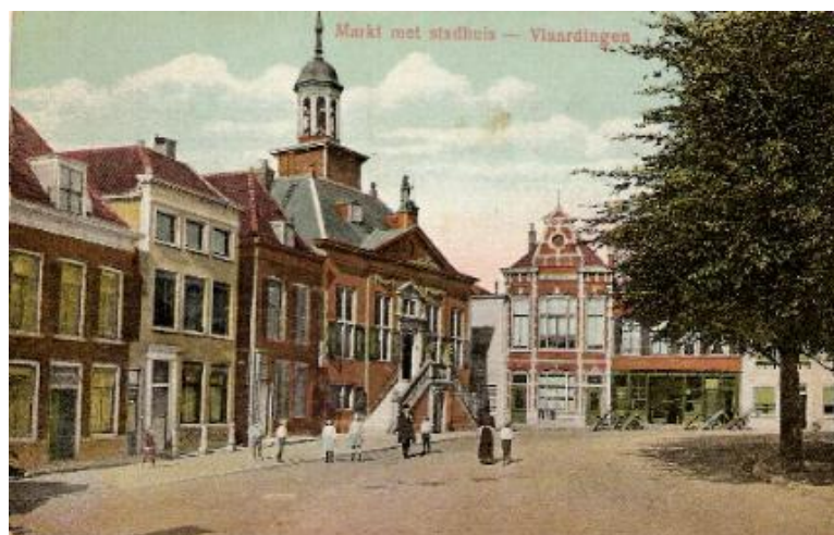
Markt met stadhuis Vlaardingen (+/- 1900)