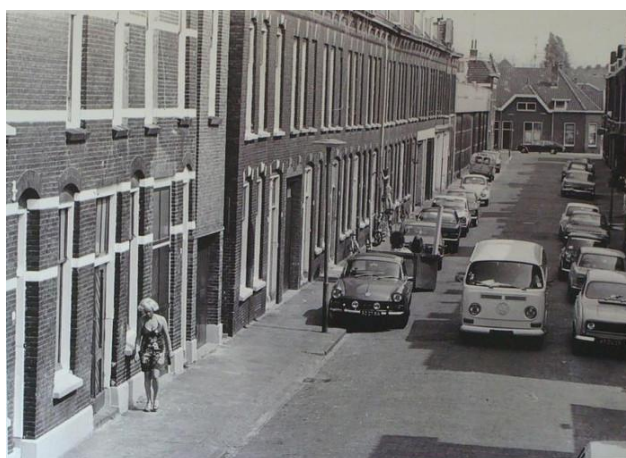
2 e Maasboschstraat in de jaren '50-'60 (inmiddels zijn deze huizen gesloopt)

Nu nog iets over de tijd dat we in de Maasboschstraat woonden, daar is best wel veel gebeurd. (O)ma heeft daar 5 kinderen gekregen en het huis werd veel te klein. We woonden in de donkere achterkamer, in de voorkamer sliepen (o)ma en (o)pa en een baby. Boven waren 2 kleine slaapkamertjes en een overloop. Zelf sliep ik in het voorkamertje, ik meen met Lydia. Op de overloop sliepen er een stel en in het achterkamertje ook. Boven sliepen er dus op het laatst 11 kinderen. Het was echt veel te klein. (O)ma heeft in haar boekje er het één en ander over geschreven.