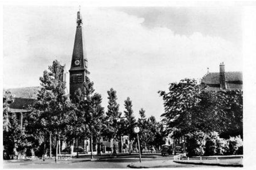
Binnensingel ca 1950

Het was voor ons als kind altijd een verrassing wanneer je uit school kwam wie er nu weer was. Ja, (o)ma trok mensen aan en dat is zo gebleven tot haar dood toe. Ook nichten en neven van (o)ma waren ondanks dat ze werelds waren erg op (o)ma gesteld. Oma van Dorp de moeder van (o)ma van der Slikke nam ons wel eens mee naar nichten en neven van (o)ma, kinderen van broers en zussen van oma van Dorp.