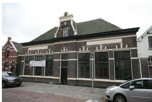
Voormalig Rode Kruisgebouw