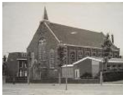
Tweede kerk Gereformeerde Gemeente te Vlaardingen (inmiddels gesloopt)

Maar daar voelde ik niet veel voor. Toen zei één van de ouderlingen dat ik op de belijdeniscatechisatie mocht komen. Dan kan zou ik het te zijner tijd zelf onder doop mogen houden. Na veel heen en weer gepraat hebben wij besloten om lid te worden van de kerk en hebben dat ook gedaan.