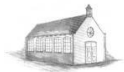
Eerste kerk Gereformeerde Gemeente te Vlaardingen

Wat voor mij heel pijnlijk was, dat was dat ik zelf ook niet gedoopt was en nog kort haar had. Later hoorde ik dat de kerkenraad nog over mij gestemd hadden of zij mij wel zouden aannemen. Slechts met één stem verschil ben ik aangenomen.