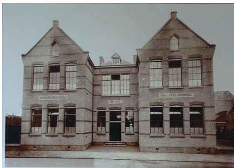
Van der Schaarschool Wilhelminastraat Vlaardingen omstreeks 1950