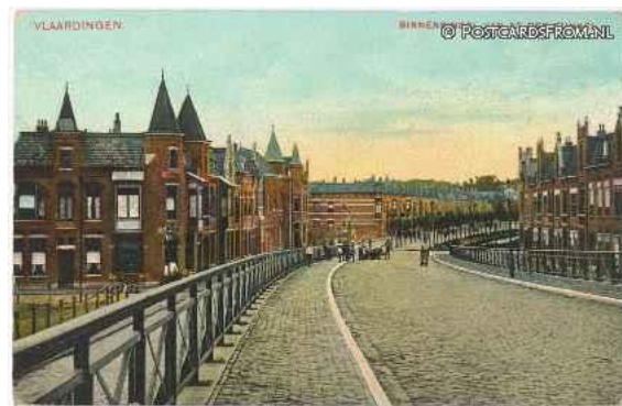
Binnensingel vanaf de tunnel omstreeks 1940