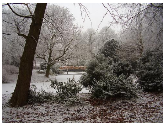
't Hof in Vlaardingen

Aan de van der Schaarschooltijd heb ik ook hele fijne herinneringen aan bewaard. In die tijd leerde ik wat te schrijven bij juffrouw Knol. 's Morgens begon zij altijd met de Bijbelse geschiedenis. Zo kwam zij bij Genesis met de geschiedenis van Kaïn en Abel. Zij vertelde toen dat bij het offeren de rook van Abel opsteeg en die van Kaïn niet. Toen schreef ik heel gebrekkig op een stukje papier: "Heere bekeer mij".