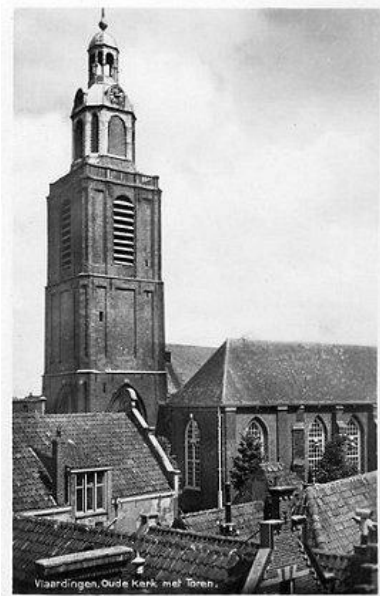
Grote kerk Markt Vlaardingen.