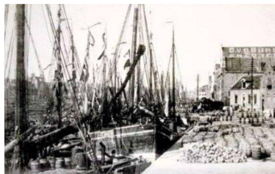
Rechts Kistenfabriek van den Burg