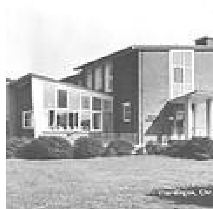
Christelijke huishoudschool aan de Van Hogendorpstraat te Vlaardingen omstreeks 1960

In die tijd ging je met de klas nog weleens naar het hof. Dat was toen voor mij een hele beleving in zo'n groot park! Later zie je dat het maar een paar kleinen veldjes zijn. Maar wij gingen daar met de klas spelen en ik had dat papiertje stiekem meegenomen en zocht een stil plekje op, achter de bosjes. Ik gooide het papiertje omhoog met de gedachten: "Als het omhoog gaat word ik bekeerd, en als het naar beneden valt niet! Ik was toen 6 jaar, maar o, het papiertje kwam naar beneden, wat was ik verdrietig en kon niet meespelen.