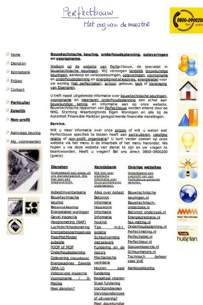
Site van Perfectbouw