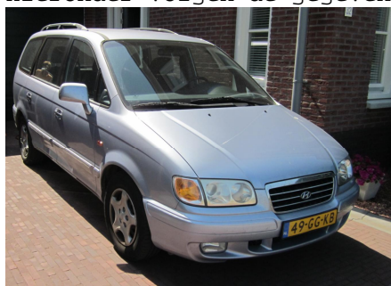
Hyundai Trajet 2.0i