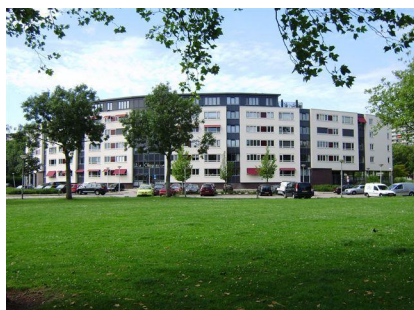
Dakotaweg 245 Capelle aan den IJssel