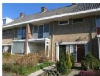
Voorkant Meerkoetstraat 23 Capelle aan den IJssel