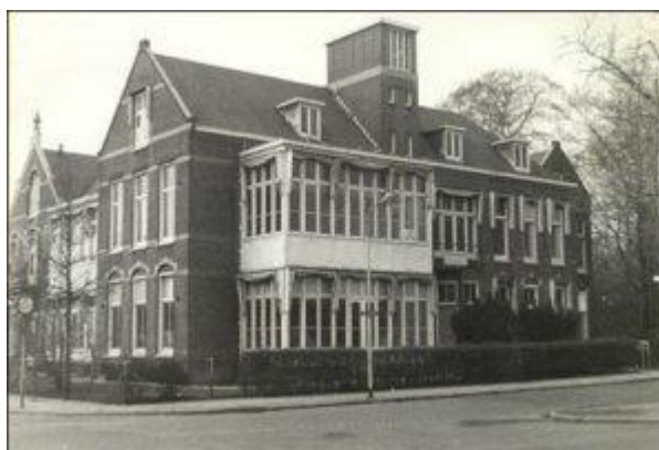
Het oude ziekenhuis Vlaardingen aan de Hofsingel gesloopt omstreeks 1965)

Alweer moest mijn moeder met mij, nu door de huisarts doorverwezen naar de KNO arts in het ziekenhuis, toen nog in het Hof. Nou dat ik zo vaak verkouden was kwam door mijn grote neusamandelen. Die moesten eruit. Er werd een grote houten stok met watten gedrenkt in een verdovend middel in mijn neus gestopt en na een half uurtje in de wachtkamer te hebben gezeten werden mijn neusamandelen eruit geknipt. Nou dat was geen pretje, ik heb er nog nachtmerries van. Daarna gelijk naar huis en over een week terugkomen of zoiets.