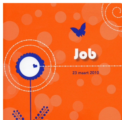
Voorkant geboortekaartje Job