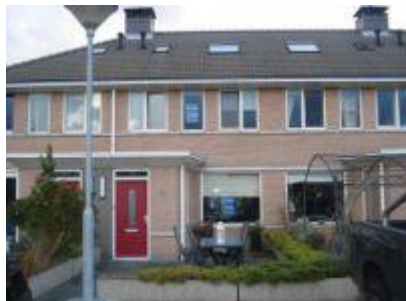
Freesiastraat 12 Capelle aan den IJssel