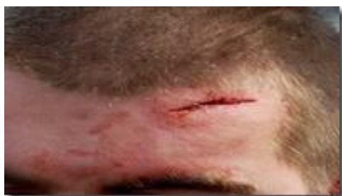
Zo zag hoofdwond er uit

Veel uit de tijd van de 1 e Maasboschstraat kan ik mij niet meer herinneren. Enkele voorvallen nog wel. De eerste is geen beste.