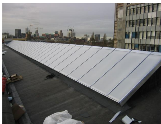
Lichtstraat na renovatie