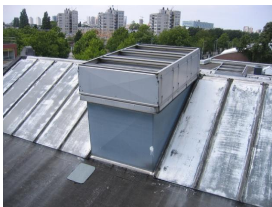
Lichtstraat voor renovatie