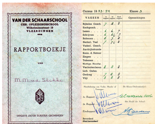
Een rapport uit 1953/1954