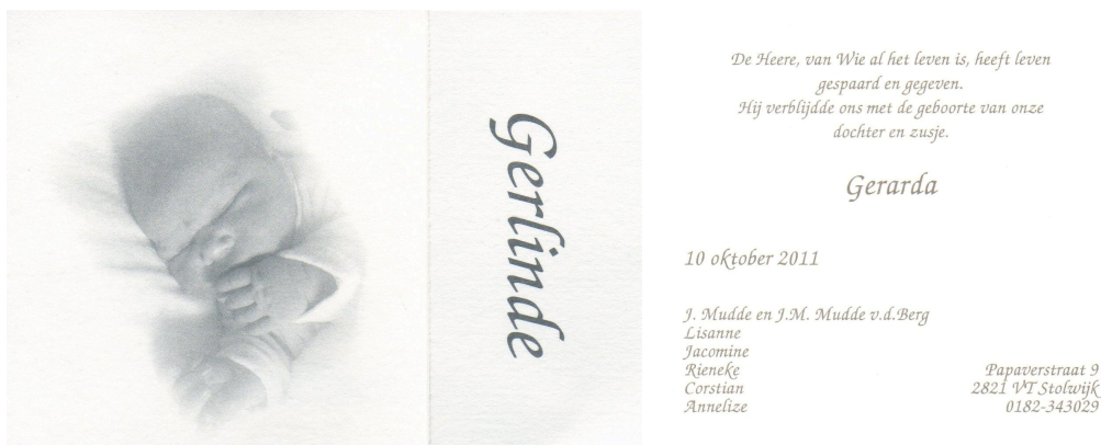
Geboortekaartje van Gerlinde Mudde

Reeds de volgende dag kregen wij het prachtige geboortekaartje.