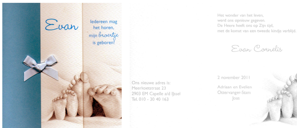
Geboortekaartje van Evan Ottervanger(11-04-02)

Enkele dagen daarna is het geboortekaartje op de site gezet.