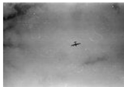
Een aangeschoten Engels oorlogsvliegtuig in 1944

firma Lensveld, een groot zand en grindhandel, in de van Leyden Gaelstraat terecht. Via wat steegjes kwam hij uiteindelijk in onze tuin en in onze schuur terecht. Daar vonden we die man. Ik kon die Engelsman niet verstaan maar mijn vader wel en aan hem vroeg die piloot waar Engeland lag. Ja, om die man bij ons te laten onderduiken was veel te gevaarlijk, dus heeft mijn vader hem de weg gewezen. Naar het westen en in Hoek van Holland overvaren.