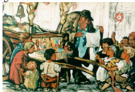
Voddenkoopman met kinderen

met een soort handweegschaal. Je kreeg voor een zak kleding niet meer dan een paar kwartjes, maar goed alles was meegenomen. Het fijnste was echter om naar het werk van die mensen te kijken. Sjonge jonge, wat een vaklui waren dat. En het bracht levendigheid in de straat. Daar kwamen geloof ik wel meer kooplui langs maar dat weet ik niet meer.