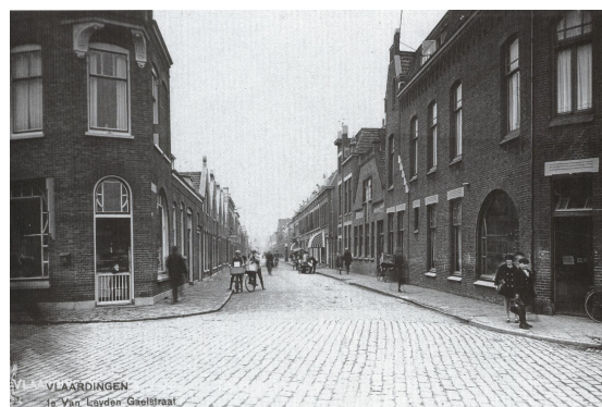
1E Van Leyden Gaelstraat Vlaardingen (rechts na 50 meter de beruchte stalling)

Voor die tijd gingen we wel een op woensdagmiddagen een fiets huren bij een fietsenhandel bij Vlaardingen Oost. Dat ging per uur. O wee, als je te laat terug kwam. Bijbetalen konden we niet, daarom was die eigenaar verschrikkelijk boos en kon behoorlijk tekeer gaan.