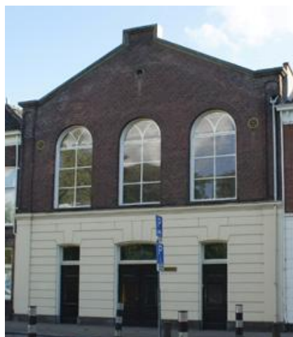
Plantagekerk te Schiedam

En Ik zal hun een Plant van naam verwekken; en zij zullen niet meer weggeraapt worden door honger in het land, en de smaad der heidenen niet meer dragen. Maar zij zullen weten, dat Ik de Heere, hun God, met hen ben, en dat zij Mijn volk zijn, het huis Israëls, spreekt de Heere HEERE, Gij nu, o Mijn schapen, schapen Mijner weide! Gij zijt mensen; maar Ik ben uw God, spreek de Heere HEERE”.