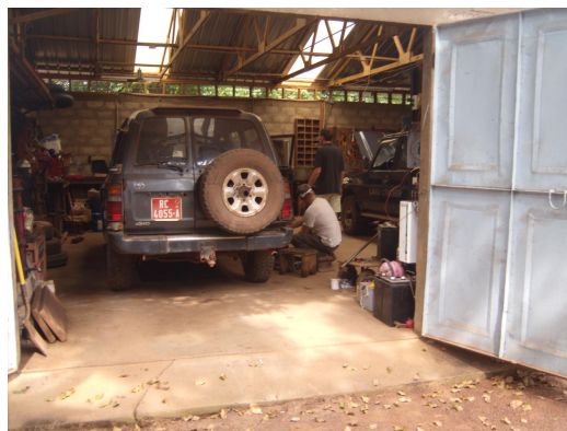
In de garage

Vroeg in de morgen stapten we in het vliegtuig en in het begin van de avond landden we op het vliegveld van Conakry, de hoofdstad van Guinee. Zoals te verwachten krijg je acuut een klap in je nek van de enorme warme vochtige lucht... Van 4 graden naar 38 graden is toch een aardige overgang. Mijn medepassagier ging voor het eerst mee en had het daar erg moeilijk mee.