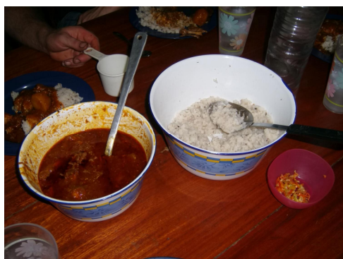
Mijn dagelijkse kostje