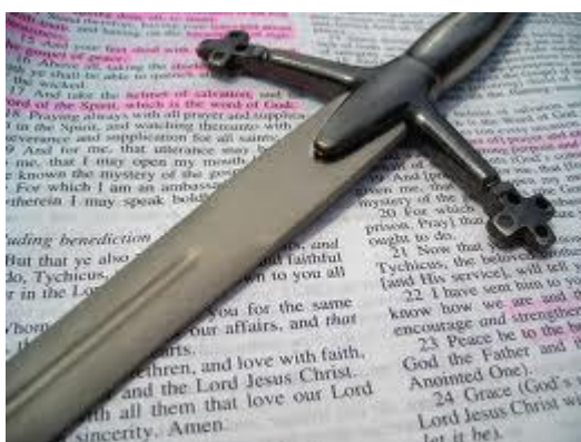
Het Woord is een tweesnijdend scherp zwaard

Toen werd ik erop gewezen op de leraars, Die brachten Gods Woord en dat waren die vurige tongen.