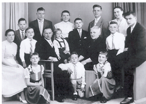
Wij waren met ons zestienen....

En toch heeft het God goed gedacht naar zulk één als ik om te zien en Zijn arbeid aan mijn te besteden. Want, ondanks alle wel en wee, (dat is er genoeg geweest) ging het genadeleven gestadig verder. Er behoeft niets in de weg te staan.