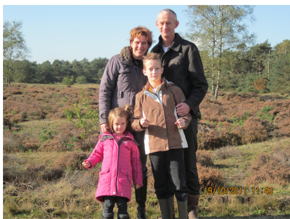
Deel 1, De Koninkjes