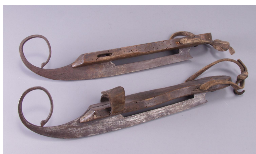
Oude Hollandse krulschaatsen

Wij schaatsten in die tijd op gekregen houten schaatsen met een krul aan de voorkant. Die krul was heel ouderwets en nog gevaarlijk ook want je bleef weleens haken aan een ander. Dus zaagden we die krul eraf. Maar toch grote einden kon je er niet mee rijden.