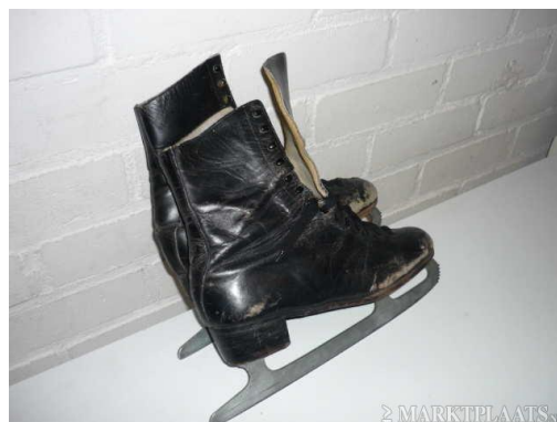
Oude rondrijders met legerschoenen