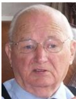
Opa van der Slikke (+/- 2000)

Dan gaan wij nu verder met Opa's Herinneringen . De periode waarover hij nu schrijft strekt zich uit van voor de oorlog tot circa 1975. Het is eigenlijk een soort samenvatting. Later schrijft Opa wat meer gedetailleerd over zijn herinneringen.