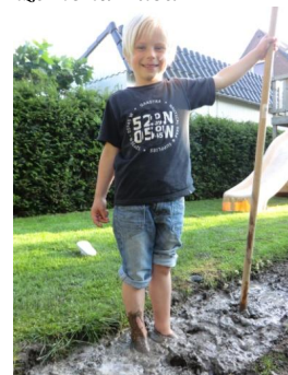
het 150 e achterkleinkind