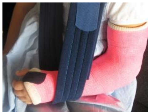
Daar zit ik dan, met mijn gebroken arm

De volgende dag moest ik gewoon weer naar school, maar ik huilde en huilde maar. Dus werd ik weer thuis gebracht met de mededeling dat ik niet eerder terug mocht komen of de dokter moest mij gezien hebben. De dokter stuurde ons meteen door naar het ziekenhuis en nog geen uur later had ik voor vier weken gips, daar mijn arm gebroken was. Zodra ik in het gips zat was de pijn verdwenen! Dat vond ik zo onbegrijpelijk, dat ik het nooit vergeten ben.