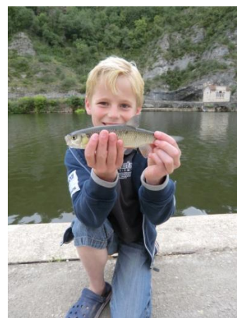
Wie doet mij na?