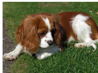
Onze hond Luca