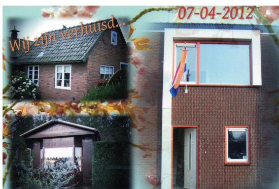
Links oude en rechts nieuwe situatie