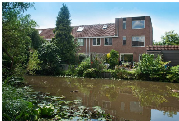
Rechts op de foto: Rigoletto 18a

Laurens Gerrets; Rigoletto 18a; 2907 JH Capelle aan den IJssel