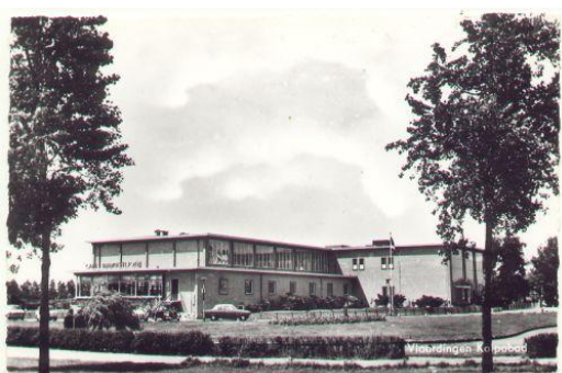
Het oude Kolpabad in Vlaardingen

In de grote vakantie had je in het Kolpabad zwemdagen voor een gulden en dan mochten we altijd, dan kregen we brood mee met banaan erop. Of je mocht een dag mee naar De Beer (een natuurgebied) op Rozenburg, dat de gemeente organiseerde voor kinderen die niet op vakantie gingen.