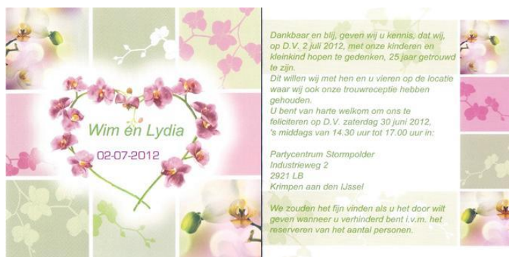
Bekendmaking 25 jarig huwelijk Wim en Lydia den Toom

(Wij begrijpen dat het voor jullie een hele opgave is om iedere keer al die kaarten en/of mails te sturen. Daarom vinden wij het zo mooi om te kunnen vermelden dat er ooms en tantes zijn, maar zelfs ook neven en nichten (!) die nagenoeg aan iedere oproep om een kaartje te sturen, gehoor geven. Wellicht moeten wij deze familieleden een keer in het zonnetje zetten).