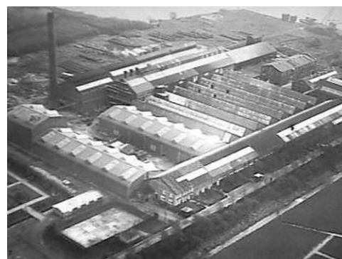
Leverzeepmaatschappij Vlaardingen +/- 1955 waar Opa werkte

Roomse familie. Moeder heeft toen mogen vertellen de weg die de Heere met haar gehouden had en over de werken Gods. Die man ging bewogen weg. Daarna vroeg zij: "Heere, waarom stuurde U niet een kind van U". Zij kreeg als antwoord: "Mijner gedachten zijn niet ulieder gedachten, en uwe wegen zijn niet Mijne wegen". Toen gaf het vrede in haar gemoed.