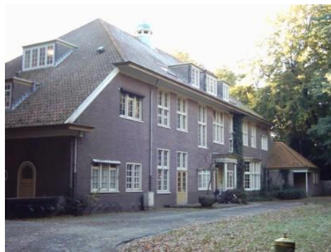
Groot Schuylenburg Apeldoorn