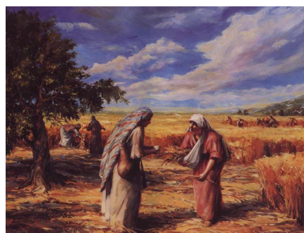
Ruth met Naomi

Aanvankelijk heeft moeder in haar ouderlijke woning veel moeilijkheden ondervonden. Zelfs is getracht haat te bewegen mij te verlaten, omdat zij vonden dat moeder levend begraven was. Zij heeft echter, (Gode zij dank), evenals Ruth een goede keuze mogen doen. Daar is een milde zegen op gevolgd. Jaren later draaide de familie wat bij.