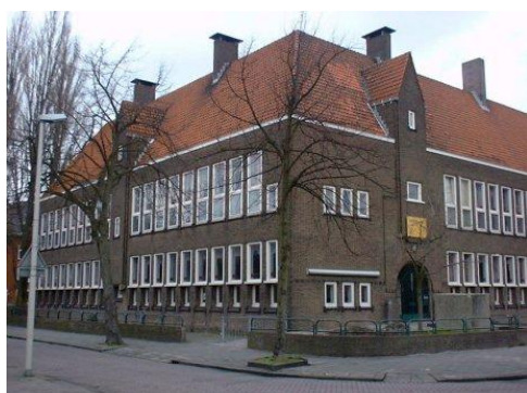
MULO-school uit de jaren vijftig

Inmiddels zal ik zo rond de twaalf jaar geworden zijn. De Dr. Colijnschool werd door mij bezocht met de bedoeling dat ik een MULO (Meer Uitgebreid Lager Onderwijs) diploma zou halen. Dat gelijk is aan wat nu de HAVO is. Je had ook de ULO (Uitgebreid Lager onderwijs)