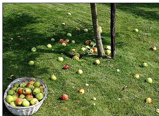
Appeltjes op de grond

Moesje, die maakt dan weer appelgelei, Jij mag haar helpen met vullen. Één potje wordt er voor jou en één voor mij, Jantje, wat zullen wij smullen.