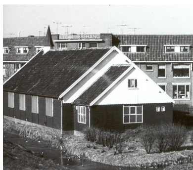
Het oude Dijklaan kerkje (inmiddels gesloopt)

Dat onze (groot-)ouders ons brachten onder de leer der Zaligheid, daar kunnen we niet dankbaar genoeg voor zijn!