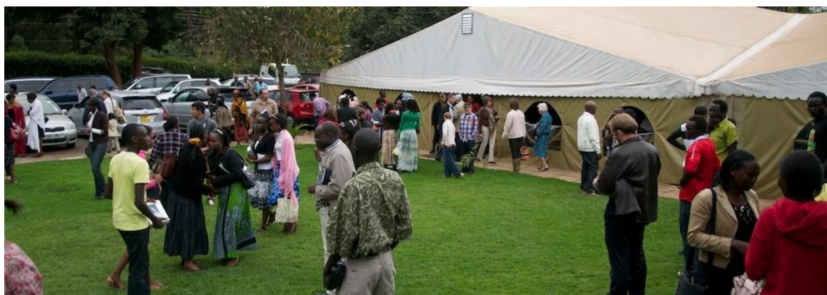
We komen samen in een grote witte tent

Met ons gezin bezoeken we op zondagmorgen de kerkdiensten van de Emanuel Baptist Church in Nairobi. Deze gemeente van ongeveer 300 man heeft een Amerikaanse oudere pastor en een Keniaanse jongere pastor.