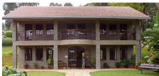
de West Nairobi School