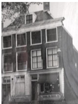
Markt 44 Vlaardingen

Moeder (oma) schreef reeds over onze zeer nare verkeringstijd. Maar wij kwamen tenslotte toch op 6 juni 1934 tot een huwelijk. Wij waren zeer gelukkig met elkaar. Er ontstonden echter al heel spoedig moeilijkheden.