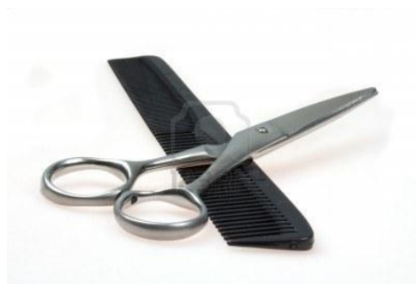
Je hoeft geen kappersspullen mee te nemen.

Naomi Klomp Gerard Doustraat 16 2902 GJ Capelle aan den IJssel 010-4501390 nyklomp@hotmail.com