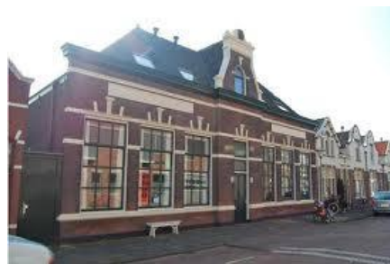
Rode Kruis gebouw Emmastraat Vlaardingen

Dan ging ik stil in een hoekje zitten, zodat je niet op viel (anders moest je naar bed) en luisterde naar waarover gesproken werd... en dat heeft toch wel de grootste indrukken achter gelaten! Dan voelde ik een heimwee..., heimwee... naar de hemel(hoe gek dit ook klinkt).