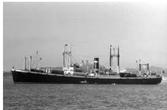
nog één reisje

Oma wachtte en wachtte en het schip was allang terug maar die man niet. Hij was in Amerika van boord gegaan om daar goud te zoeken en op die manier aan geld te komen. Doch na een halfjaar was hij nog niet terug. Er is naar het consulaat geschreven om inlichtingen maar daar is niets uit gekomen en na een jaar is hij als vermist opgegeven.