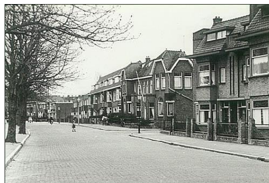
Parkweg gezien vanaf de Binnensingel

Maar weer tobde ik met mijn gezondheid, omdat het huis te vochtig was, zodat wij na ongeveer twee jaar verhuisden naar de Bachstraat. Daar woonden wij tot het uitbreken van de oorlog. Hier is veel gebeurd. Ik heb door bijzondere omstandigheden hier mijn verloren staat in mogen leven. Daar ben ik in opgenomen en, ik denk door wel een zeer zware strijd die daarmee gepaard is gegaan, geheel lichamelijke ingestort.