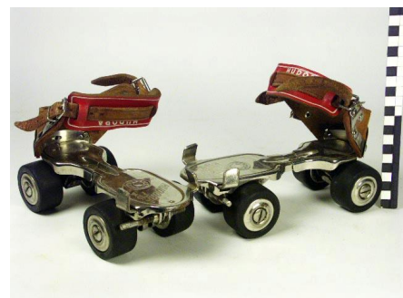
Ik kreeg Hudora rolschaatsen