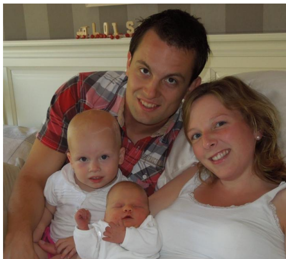
Hier nog een familiefoto van ons

Nou ik hoop dat jullie zo een beetje een beeld hebben van wie wij zijn. Willen jullie ons nog beter leren kennen, kom gerust eens langs in Ermelo!!