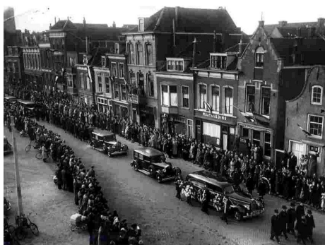
De begrafenis van de vijf brandweerlieden

(o)pa) geweest en liepen terug naar huis vanuit de Wagnerstraat naar de Hofsingel in Vlaardingen.