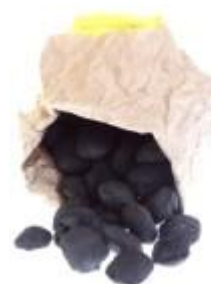
En ook nog een zak kooltjes

Je kunt geloven dat wij toen de kooltjes met tranen hebben aangemaakt.