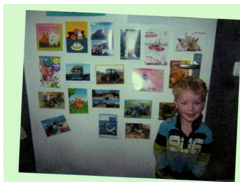
Ik heb echt een heleboel kaarten gekregen

----- Van “ de Jarige van de maand november ” kregen wij de volgende mail.