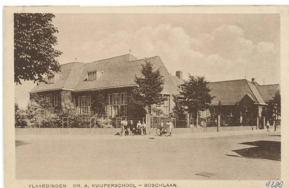
Dr. A. Kuijperschool, Boschlaan te Vlaardingen (ca. 1960)