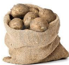
Kregen wij een zak aardappels

Het was een zeer moeilijke tijd voor ons. Ten laatste niet aan eten en kleren te komen. Hoewel wij vergingen van honger, heeft niemand onzer hongeroedeem gekregen, hetgeen velen hadden. Soms kregen wij op een wonderlijke wijze uitkomst. Ik zal slechts enkele dingen noemen.