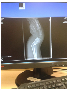
Is het nou wel of niet gebroken?