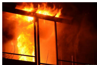
In een mum van tijd

HEERE help toch. En verdwaasd kijk ik van af de bomen iets van het huis naar de vlammen in de keuken en die via het afvoerpijpje omhoog lekken.