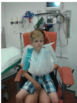
Dat is echt schrikken