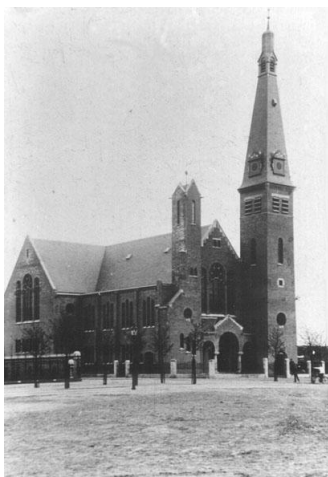
Nieuwe kerk (gesloopt)

Op de zaterdag dat ik de aansteker gevonden had, probeerde ik of hij het deed. Maar wat een teleurstelling, ik kreeg hem niet aan de praat. De benzine was op. Gelukkig had mijn vader voor zijn bromfiets een blik met 5 liter benzine in de kast staan. Het stond wel hoog, in een kast in de zogenaamde uitbouwkamer, want als de kinderen erbij kunnen is dat natuurlijk veel te gevaarlijk.