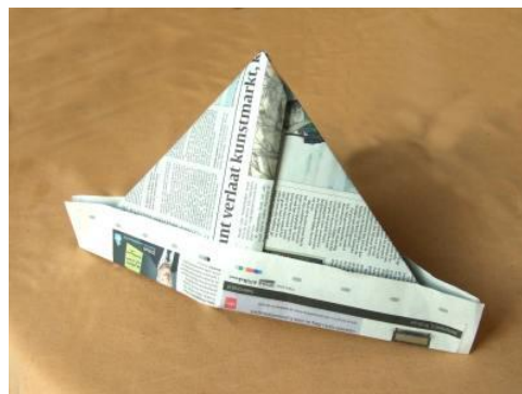
Hoedje van papier

En als het hoedje dan niet past Zetten we 't in de glazenkas Een, twee, drie, vier Hoedje van papier