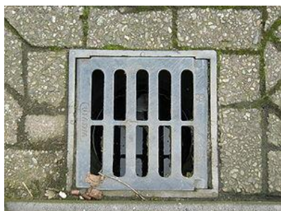
Dan maar in de straatput

Wat nu, ik poetste met mijn zakdoek, probeerde de pepermuntrest aan de stoeprand eraf te krijgen. Doch tevergeefs. Alle pogingen mislukten.