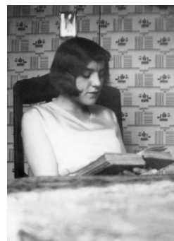
Oma omstreeks 18 jaar oud

Ik ben toen in huilen uitgebarsten en ook in de gemeente waren velen ontroerd.