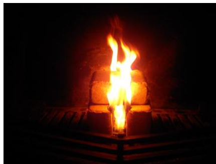
Jawel hoor, het brand.

O de vork! Het is één geworden met het verbrande pepermuntje.