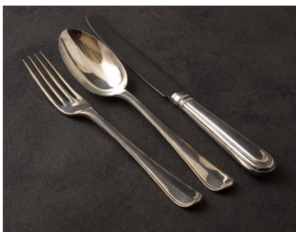
Het zilver bestek

Ik hoorde van vriendjes in de klas dat pepermuntjes zo prachtig branden. Ik geloofde er niets van, maar toch werd mijn nieuwsgierigheid gewekt. Zou het waar zijn en hoe zou ik dat uitproberen? Om een brandend pepermuntje in mijn hand te houden, nou dáár wilde ik mijn vingers niet aan (ver)branden. Weet je wat, ik neem een doosje lucifers mee bij het gasstel en pak gewoon de eerste, de beste vork mee die ik zie. Leg er het pepermuntje op en een vlammetje erbij en dan zie ik wel of het écht waar is.