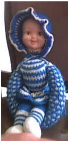
is het geen schattig popje?

zat 5 gulden in en hij stuurde ze op tijd op zodat hij niet te laat zou komen. Zelfs aangetrouwd, ieder hield hij bij. Op je kaart stond je nummer hoeveelste (achter) kleinkind je was en altijd de wens voor een nieuw hartje.