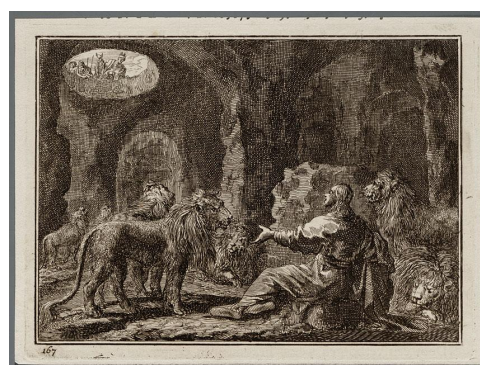
Daniël in de leeuwenkuil

Drie maanden heb ik het vast kunnen houden. Toen werd ik bepaald bij Daniël, hoe hij bij de koning was, van zijn tafel had gegeten en gedronken. Dat deed ik in die dagen ook, want mijn ziel was uitgedroogd. Maar Daniël moest nog de leeuwenkuil in. En zijn drie vrienden moesten nog de oven in.