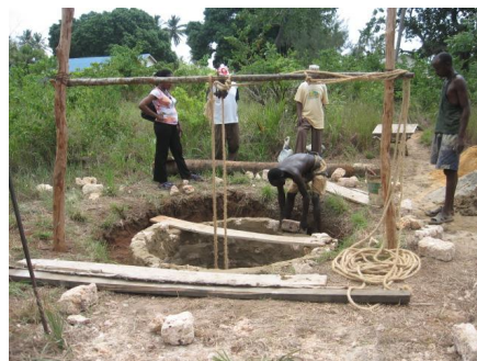
Maken van een waterput

Op dit moment zijn ze bezig met een waterput aan het maken bij een school waar ze geen water en geen elektriciteit hebben. Deze school ligt in het voormalige oorlogsgebied er zijn daar heel veel slachtoffers gevallen. Ook zijn we in een ziekenhuis geweest wat je niet kunt vergelijken met een ziekenhuis in Nederland.