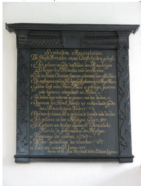
Twaalf artikelen des Christelijke geloof

ik niet eens wist dat ik een ziel had voor de eeuwigheid, en toen de Heere door ging trekken, kwam ik schuldig te staan aan de wet, als ik deze in de kerk voor hoorde lezen.