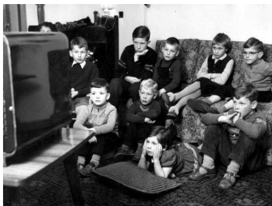
Televisie kijken in de jaren vijftig bij je vriendje

Met kinderen misvormen mag je helaas zo beginnen, ook al heb je geen verstand en geen kaas gegeten van opvoeding of weet je helemaal niet wat goed is voor een kind of wat goed doet. Veel onwetende ouders, helaas weer vooral door onjuiste of zieke normen en waarden, beschadigen een kind voor zijn verdere leven.