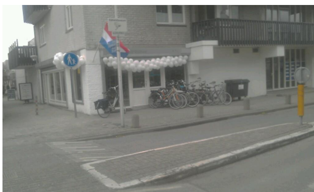
De Fiets-en-Maker zaak