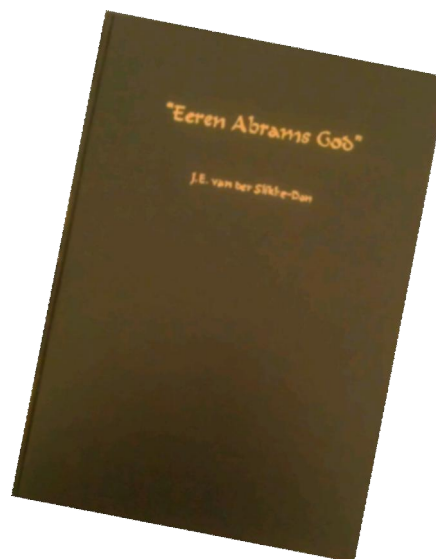
1 e proef

Via deze nieuwsbrief hopen wij jullie in de komende maanden op de hoogte te houden van de verdere ontwikkelingen.