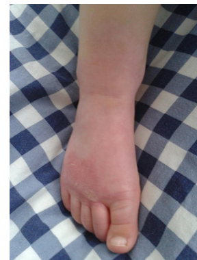
Het ziet er weer mooi uit.

We mogen een maand weg blijven, ze heeft litteken zalf mee gekregen en nu nog hopen dat die ene plek nog minder zichtbaar wordt.