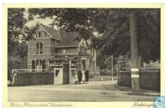
Huize Bloemendaal Loosduinen

Laatst nog eens iemand die ongemakkelijk wordt als hij mij ontmoet. Ik zei: "Hebt u wel eens een kind gehad". Nee, natuurlijk niet, "Nu dan kunt u niet de smart die dat meebrengt begrijpen.