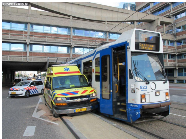
Ambulance botst op tram, patiënt loopt naar het ziekenhuis

Wat was er gebeurd? Kijk als er iets op de weg gebeurt dan kan het gebeuren dat je dat over het hoofd ziet. Dat schijnt ook met een tram te kunnen gebeuren. De chauffeur had een tram over het hoofd gezien en was erop gebotst in Amsterdam. Het vervelende was echter dat er een patiënt in de ziekenwagen lag. Het verhaal vermeldde niet of die patiënt beademd werd of aan de hartmonitor lag of aan het infuus maar wel dat de ziekenwagen beschadigd was en niet verder kon rijden. Nou ja wat doe je in