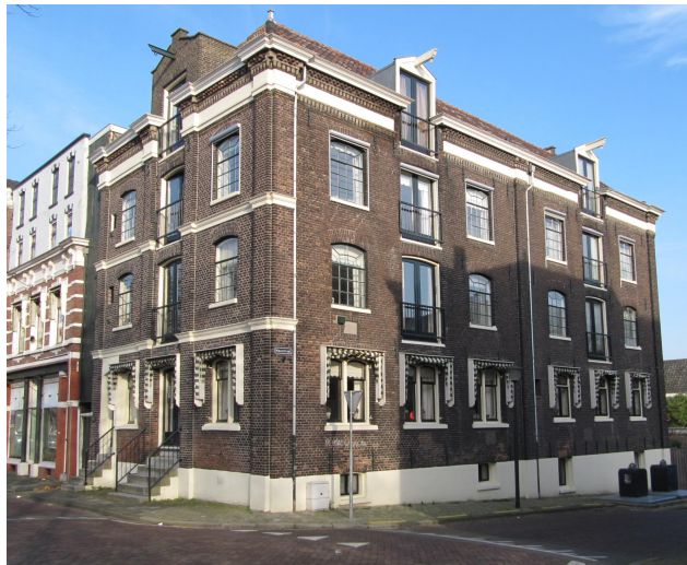
Een voormalig haringpakhuis van de firma Abshoven