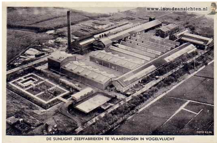
Sunlight ca 1950

Het is ook het bedrijf waar opa zijn meisje leerde kennen. In het boekje “Eeren Abrams God” heeft oma het een en ander hierover geschreven.