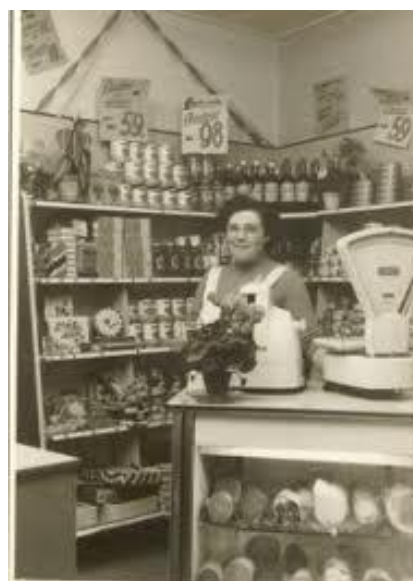
Een ouderwets kruidenierswinkeltje

Door al deze omstandigheden was het winkeltje niet levensvatbaar en moest ze het sluiten.