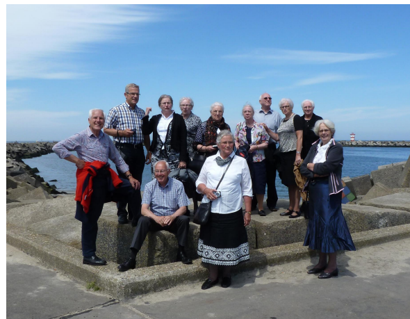
“The Sweet Black Angels”

In het museum zat een vrouw aan de balie, die ook al heel verbaasd was dat zo’n grote groep juist deze dag het museum kwam bezoeken. Wisten we wel dat het vandaag vrijdag de dertiende was? Dat is een dag die ongeluk aanbrengt! Nou wij brachten het tegenovergestelde, zo wisten we haar ervan te overtuigen. En dat merkte ze ook want tijdens ons bezoek werd ze steeds vriendelijker.