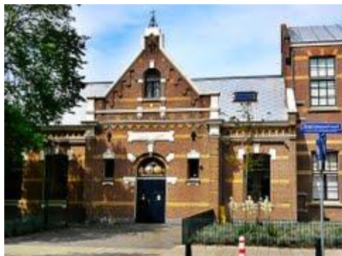
Muzee te Scheveningen

Zo'n vriendelijke en behulpzame groep dat maakte ze ook niet elke dag mee. Die mensen zette de stoelen op hun plaats, ze ruimden hun rommel op, gaven de gids een fooi, hielpen met bedienen, betaalden, kortom voortreffelijke museumbezoekers.