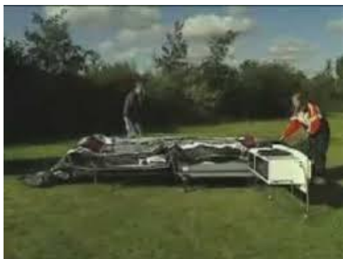
die we met behulp van de familie in elkaar zetten

nodig en met hulp van minstens twee man (dus man en vrouw) lukt het om in één ochtend de caravan op te zetten. Je kunt natuurlijk niet steeds dezelfde mensen vragen, dus doen we het op een slimme manier.