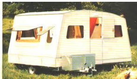
Na twee weken mag het resultaat er zijn

Volgens de fabrikant kan het met twee mensen al. Maar ik vermoed dat ze bodybuilders in gedachten hadden. Kijk een vouwwagen, een Alpenkreuzer ja die kan je gemakkelijk met twee man opzetten, maar een vouwcaravan is toch weer anders. De zijwanden moeten omhoog en het dak moet omhoog en dan omgeslagen. Er moeten twee tussenstukken tussen twee wanden geperst worden. Nou, soms kost dat wel een paar pleisters. Afijn, om zomaar eens wat te zeggen, zo zal ik maar zeggen, om kort te gaan, het is geen peulenschil.