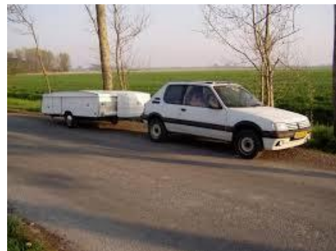
Wij hebben een vouwcaravan,

Dat vrolijk moet u natuurlijk figuurlijk verstaan. Want het kost een heleboel zweet en tranen om dat ding overeind te zetten. De eerste keer stond hij pas goed en netjes overeind aan het eind van onze vakantie. Inmiddels is dat teruggebracht tot een hele ochtend. U zult zeggen, nou dat is geweldig. Jawel, maar dat komt door de familie. Kijk, als we ergens naar toe gaan charteren we een zoon of dochter, getrouwd natuurlijk want we hebben mankracht