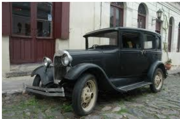
Kon hij een auto huren van een vriend...