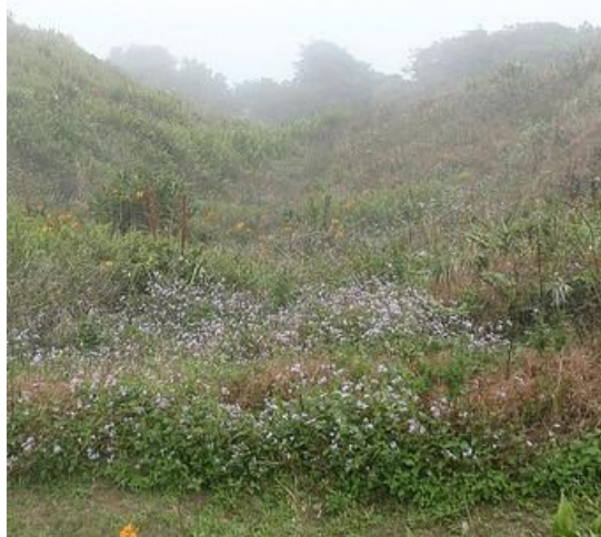
In het groene dal, in het stille dal

Omhoog, omlaag, op berg en dal Ben 'k in de hand des Heeren Toch kies ik, als ik kiezen zal Mijn stille plek, mijn waterval Toch blijf ik steeds, naar mijn begeren, De kleinste Toch blijf ik steeds, naar mijn begeren, De kleinste