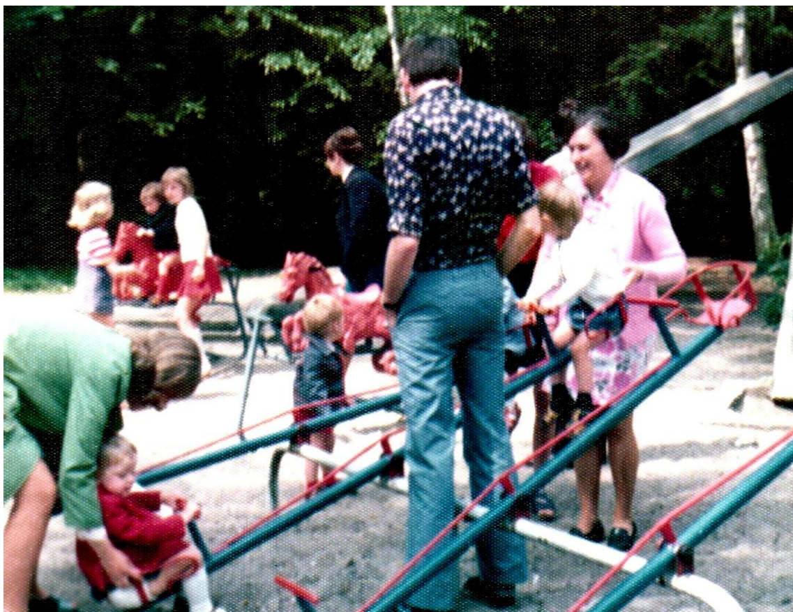
Wie is wie?