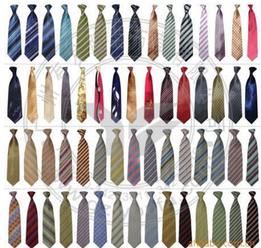
Je hebt zoveel soorten dassen ...

Uit de kerk gingen ze met ons mee koffie drinken. We waren maar nauwelijks thuis of ik struikelde over mijn woorden wat er aan de hand was. ‘Wel’, vroeg mijn schoonzoon verbaasd, “waarom ik in de kerk zijn stropdas omhad”? Hij was al weken zijn zondagse stropdas kwijt en nu droeg ik die mooie das! Nou moet ik zeggen, dat het een dure das was. Zelden heb ik zo’n mooie das gedragen. Je hebt goedkope dassen en dure dassen. Je hebt zijden stropdassen en satijnen. Je hebt geweven stropdassen, brede en smalle stropdassen en ga zo maar door. Een stropdas maakt een heer of niet. Ik ken een man die draagt een stropdas zo lang dat het bijna op zijn kruis hangt, geen gezicht.