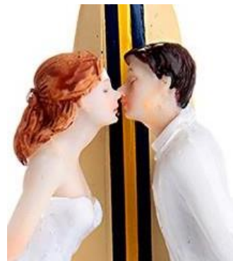
Een bruid zoenen?

Kortom, geliefde familie, zoenen en kussen mag, maar wel met mate. Bijvoorbeeld een bruid zoenen, dat lijkt me wel wat, hoewel ik onlangs bij een huwelijk de durf niet had om het te doen. Ik dwaal af, we hadden het over tijden die veranderd zijn en over jong volwassenen. Die jong volwassenen lijken tegenwoordig allemaal of hoogbegaafd te zijn of een ontwikkelingsvoorsprong te hebben. Ze geven aan wat ze wel willen eten en wat niet. Hoe laat ze naar bed willen en wanneer niet. Als ze wat ouder worden vertellen ze je wat je goed doet en wat verkeerd. Worden de kleuters, jong volwassenen maakt dan je borst maar nat. Ze weten veel beter welk mobieltje je moet kopen dan hun pa. Maar ze weten ook veel beter hoe je moet opvoeden. En als ze groot zijn kopen ze een Mercedes, niet zo'n klein autootje als hun pa.