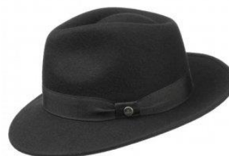
Opa's nieuwe hoed

Om te voorkomen dat opa zijn hoed kwijt zou raken, heeft hij de letters MvdS in laten zetten. Want in die tijd droeg nagenoeg alle mannen een hoed, en een verkeerde hoed is zo gepakt. Maar ondanks deze maatregel was opa al gauw zijn hoed kwijt.