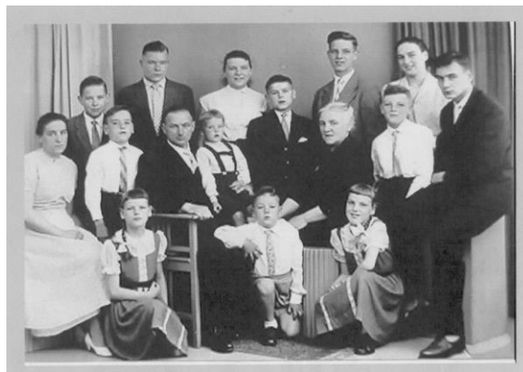
Dit was vroeger heel gewoon

Zijn moeder zat bij wijze van spreken heerlijk onderuitgezakt in een fauteuil en zoonlief van 11 jaar kroop op de schoot van zijn moeder. Hij omknelde en omhelsde haar als een octopus.