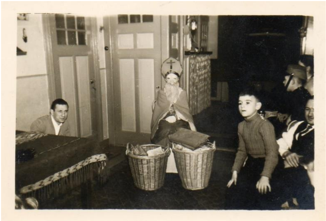
Op de foto staan v.l.n.r.

's Avonds om zeven uur moesten wij allen in de woonkamer zitten en plotseling werd er hard op de deur gebonsd. En ja hoor, daar kwam Sinterklaas binnen met twee grote manden vol cadeautjes. De kleine broertjes en zusjes waren echt bang van hem omdat zij dachten dat hij de echte Sinterklaas was. Het is een hele gezellige avond geworden en allen hebben hiervan genoten.