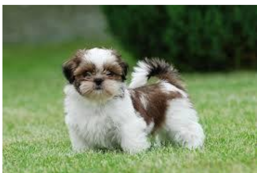
Een Shih Tzu

Ik mag niet afvallen en klachten mogen niet toenemen. Ik blijf maar optimistisch.