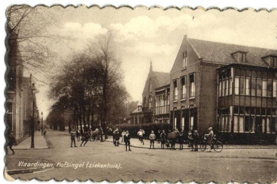
Algemeen ziekenhuis te Vlaardingen