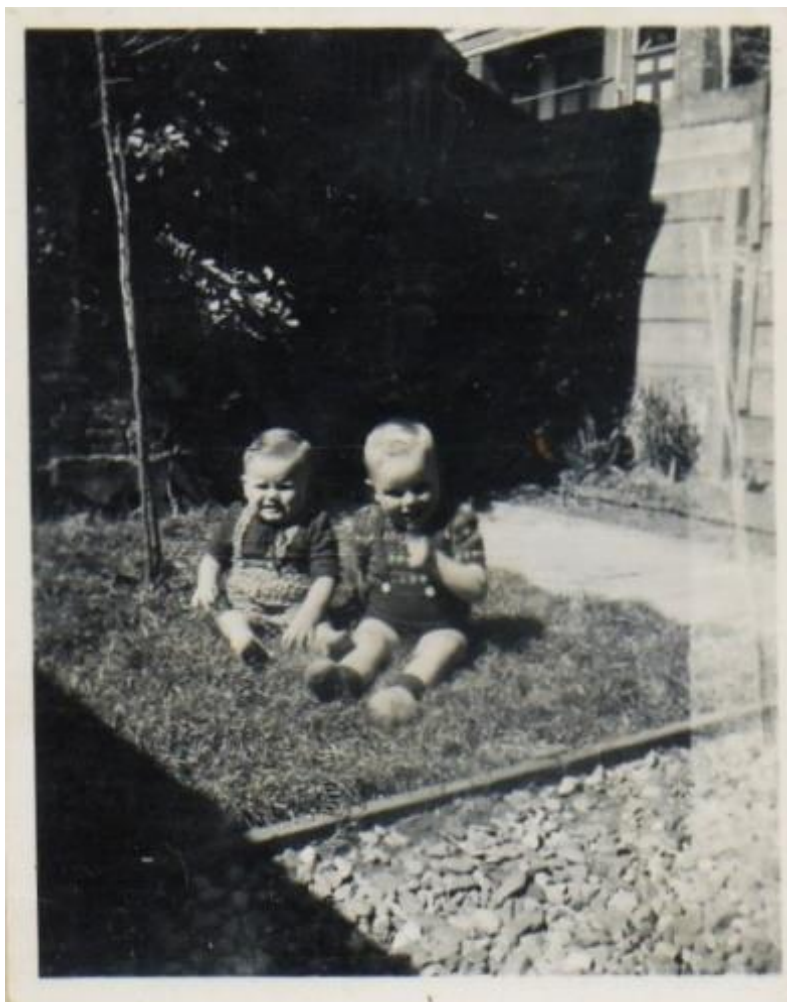
(oom) Cees en (oom) Maarten

Onderstaand vinden jullie weer een foto uit de fotogalerij van (tante) Lydia . Dit is echt een foto uit de oude doos. Het is niet moeilijk te raden wie dit zijn.