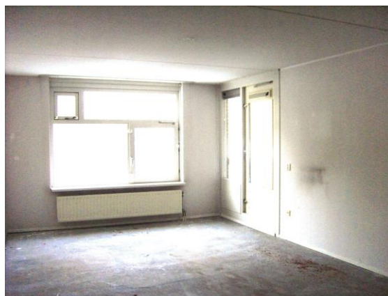
Het huis kwam vanzelf leeg

Destijds bij het overlijden van pa en moe (opa en oma van der Slikke) hebben we in onze familie de hoofden bij elkaar gestoken en alles eerlijk (althans ik hoop dat iedereen dat vindt) verdeeld. Zo kwam het huis vanzelf leeg. Maar wat als kinderen niets uit de erfenis willen hebben? Of zeggen: "Mijn huis staat al zo vol". Dan worden kleinkinderen ingeschakeld, kennissen en vrienden en bij deze mensen worden dan de bezittingen gratis aangeboden. Als die ook niets willen hebben? "Het is mijn smaak niet". "Het past er niet bij". "Ik hoef die troep niet", wat dan?