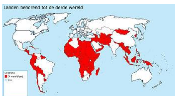
Landen van de "Derde wereld".

Je gedachten gaan dan wel naar de derde wereld en de stromen vluchtelingen. Is er niet iets mis met de verdeling van de goederen van deze aarde?