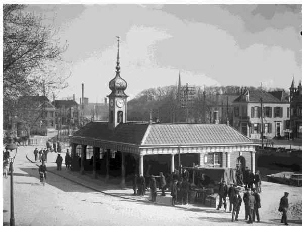
Visbank te Vlaardingen