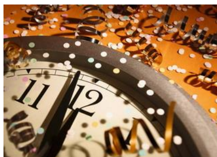
Het werd dan toch 12.0 uur

Nou ik vond het altijd leuk om een quiz te maken. En dan altijd een paar prijsjes erbij. Dat maakte het spannend. Niet dat je voor al die moeite werd beloond, kan je geloven! De één was boos dat de ander een veel makkelijker vraag kreeg en een ander was weer boos dat hij niet in de prijzen viel. Maar goed op enkele oneffenheden na werd het dan toch 24.00 uur. En raar eigenlijk, maar vaak was je vroeger 's avonds niet naar bed te branden, maar op Oudejaarsavond had ik om 11.00 uur al slaap. En de andere morgen was het nog erger, dan liep je een hele tijd te slaapwandelen.