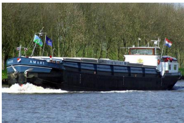
Het binnenvaartschip “Amare”

Van het schippersechtpaar van de “Amare”, te weten (oom) Cees en (tante) Elisabeth Mudde- van der Slikke en hun kinderen ontvingen wij een prachtige kaart waarin zij mededelen dat D.V. zaterdag 14 februari 2015 het veertig jaar geleden is dat zij in het huwelijk werden verbonden.