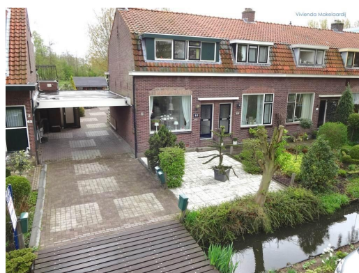
Ons nieuw paleisje