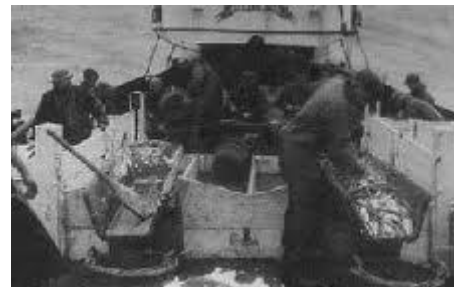
Vlaardingse vissers op zee

“ Het oude jaar is haast voorbij, en we hopen het nieuwe te treden, te treden. Mijn vader is een vissersman. Die zuur zijn broodje verdienen kan. Het Oude jaar uit en het Nieuwe jaar in. Mijn beursje staat open wie gooit er wat in”.