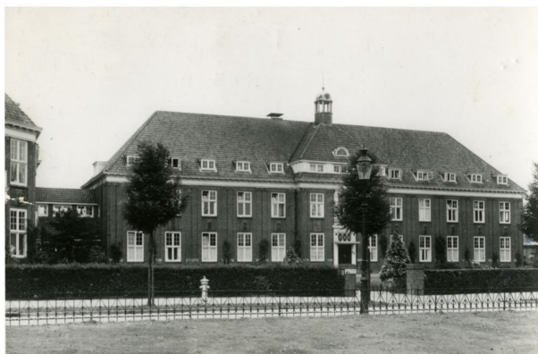
Het oude gemeenteziekenhuis te Schiedam

Vele arbeiders werden in Duitsland te werk waren gesteld of ondergedoken. Gelukkig behoefde opa niet naar Duitsland. Maar bij een aantal kinderen kreeg je van de Duitsers vrijstelling. Nu werd dit aantal door de Duitsers ieder jaar verhoogd. En wonderbaarlijk, ieder jaar voldeed opa hieraan doordat er ieder jaar het gezinnetje uitbreidde met een zoontje of dochtertje. En doordat oma zwanger was, kwam zij in aanmerking voor extra voedsel. En van dit extra voedsel kregen de kinderen om de beurten 's avonds een boterham. Dan werd degene die aan de beurt was wakker gemaakt. Maar meestal was degene die aan de beurt, al wakker.