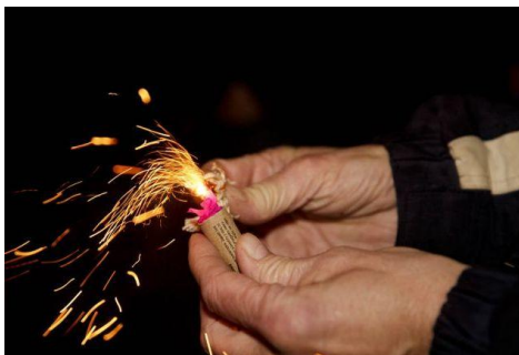
Hij heeft het toen in de garage afgestoken

Dus heb ik hem met angst en beven een doosje lucifers gegeven. Wat was ik blij toen hij even later zonder verwondingen weer heelhuids binnen kwam. Geen arm eraf e.d. Heel trots mocht hij een poosje later wel van zijn moeder een sterretje afsteken. Nou die heb ik in mijn jeugd ook wel afgestoken, maar daar is het bij gebleven.