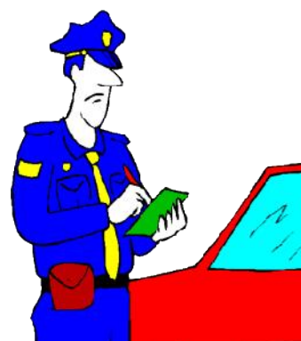
Dat wordt betalen