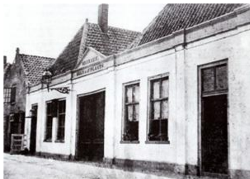
Ingang begraafplaats Emaus (begin 20 e eeuw)

Doch de woningsnood was door en na de oorlog zo groot, dat er geen woningen beschikbaar waren. En kwam er ergens een woning vrij, dan was er altijd wel een ander gezin waar de nood nog groter was.