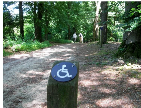
Ik liep eens in het Hitlandbos...

Ik liep eens in het Hitland bos en daar is een knuppelpad noem ik het maar, met enkele houten vlonders van een paar honderd meter lang over een moeras. Leuk om te lopen. Maar het pad na één van die vlonder is zo smal dat een rolstoel er nauwelijks over heen kan. Dus Ilona in die rolstoel werd over dat pad heen en weer geslingerd. Ik wou eerst nog teruggaan, maar ja ik had A gezegd dus ik zei ook B. Nou weet ik niet hoe dat voelt als je in een rolstoel over een zandpad gereden voelt, maar Ilona gaf geen kik.