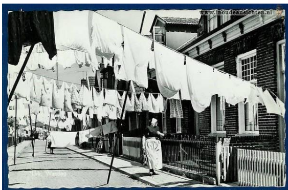
Want op Urk doen de moeders de was!

Toen de a.s. leerkracht dan ook de babykleertjes op een schoolbank legde werden ze met aplomb op de grond gesmeten. De leerlinge aan een andere schoolbank was minder rigoureuus maar ging omgedraaid met een andere leerlinge in één of ander dialect in gesprek. Weer een ander ging zich er ook mee bemoeien en zo ontstond een levendige discussie waar de a.s. onderwijskracht niets van verstond. Opnieuw verzocht een leerlinge of ze bij de conciërge een paracetamol mocht halen want ze had buikpijn en de juffrouw moest begrijpen dat zoiets maandelijks gebeurt. Ook dit verzoek werd toegestaan. Maar ze was niet van gisteren, want ze had een degelijke opvoeding gehad en dus toen ook deze leerlinge de deur uit was begon ze in rap Riessens ( een dialect uit Rijssen) haar verhaal verder te vertellen. Daar hadden de meisjes niet van terug.