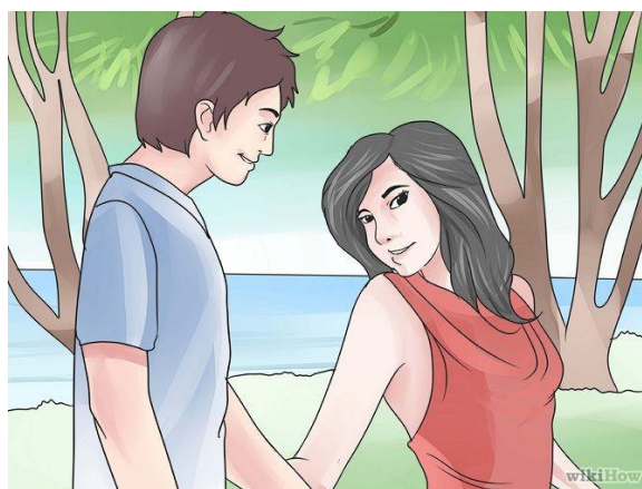
Hoe kom je aan een leuke jongen?

Toen de les begon was er even belangstelling, maar al gauw was voor de vrouwelijke leerlingen de lol eraf. Babykleertjes daar waren ze nog lang niet aan toe, ze waren veel meer geïnteresseerd in hoe je een leuke jongen aan de haak kon slaan. De les was nog maar nauwelijks begonnen of een leerlinge zei dat ze hoofdpijn had en of ze bij de conciërge een paracetamol mocht halen. Nou dat kon de leerkracht niet weigeren natuurlijk. Maar toen er gesproken werd over Ph en Dh (Duitse hardheid) was het hek van de dam. Ze gingen met elkaar in discussie en de leerkracht kon de boom in.