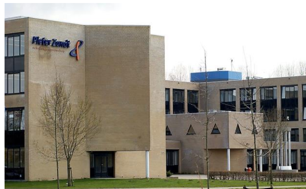
Pier Zandt Scholengemeenschap

De sollicitatie liep voorspoedig. Zowel het bestuur als de directeur waren positief over haar kwaliteiten. En als bewijs van haar kundigheid mocht zij een proefles geven. Nou daar was ik niet bang voor, wel benieuwd natuurlijk. Het onderwerp ging over de gezinswas. Zij had zich terdege voorbereid en had de babykleertjes van haar jongste zoon uit de mottenballen gehaald want ja, haar eigen kleren daar kon je over van mening verschillen, maar babykleertjes. vertederen vrouwen altijd Goed het waren leerlingen van 14 à 15 jaar maar toch, in ieder meisje zit een moeder toch? De klas die ze les moest geven bestond uit 12 meisjes. Hoe moeilijk moest dat zijn!