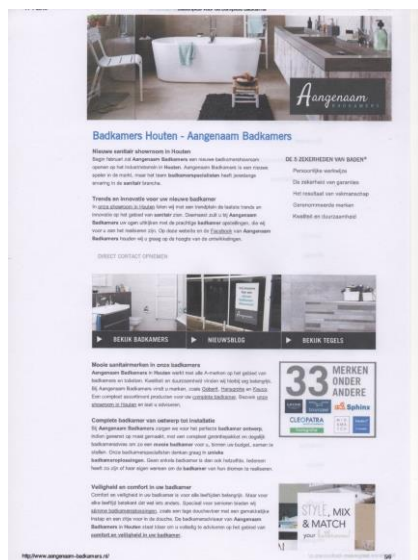
Een impressie van der site