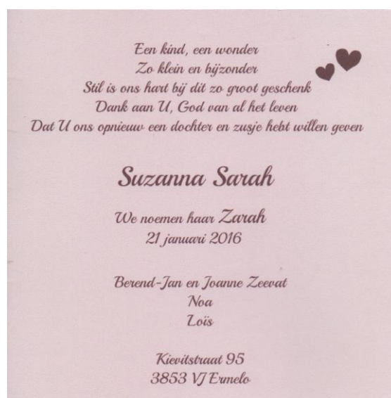
Geboortekaartje Zarah Zeevat

En zoals jullie zien mochten wij inmiddels ook een prachtig bedankje ontvangen