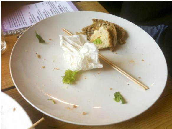
Wat bleek nou, mijn vrouw had meer dan de helft op!

container, behalve dan de doos zelf en de servetten. Alles opgegeten! Ik ben mijn familie heel erg dankbaar maar toch... Ik ben blij dat het nog 10 jaar duurt voor ik 60 jaar getrouwd ben. U ook!