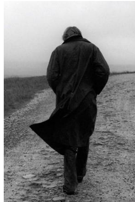
Eerst maar een stevige ochtendwandeling en dan..

Er bleef maar één mogelijkheid over, zo begreep ik wel. Of de Voedselbank of de Stichting "Ontmoeting". Ik heb toen met mijn vrouw overlegd want mogelijk konden we een dubbel portie eten daar afgeven.