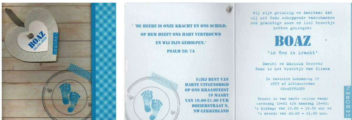
Geboortekaartje van Boaz Gerrets

En zoals jullie op het geboortekaartje kunnen lezen, staat de betekenis van zijn naam er bij, dus is het niet nodig dat het apart vermelden.