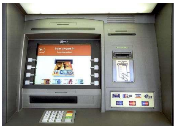
Op allerlei knoppen ingedrukt...

Toen ik weer aan de beurt was opnieuw geprobeerd, maar helaas er was geen mogelijkheid om die vijftig euromunten te pinnen. In mijn hulpeloosheid ben ik naar de receptie gelopen en heb mijn verhaal gedaan. Bleek ik bij de verkeerde automaat te staan. Toen heb ik bij de goede automaat op allerlei knoppen gedrukt in de hoop mijn rolletje munten te verkrijgen. Nou het lukte dacht ik aardig maar ik moest aan kosten zowat een vermogen betalen, meer dan ik pinde.