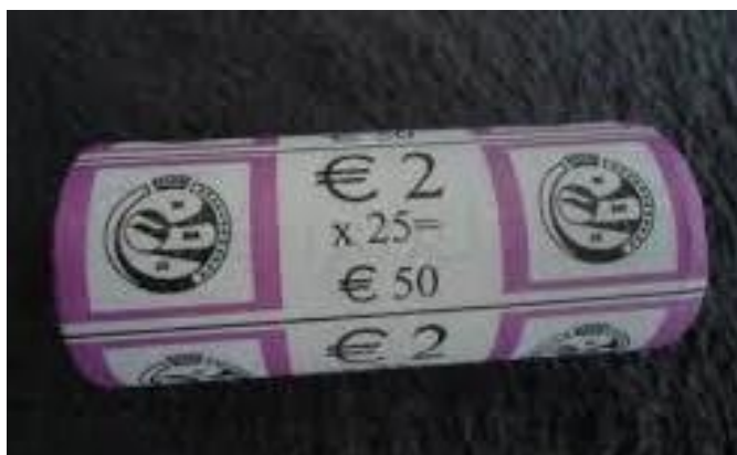
Toen kwam er een rolletje van twee euromunten ...

Een hartelijke groet van uw columnist. (oom) Johan