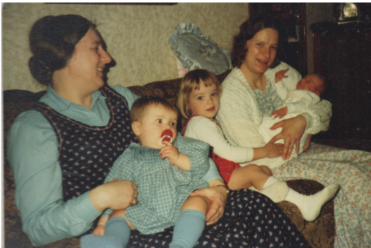
Het zal niet moeilijk zijn om te raden wie op deze foto staan.

Het is een soort raadfoto geworden. Onderstaand hebben wij wat veronderstellingen gedaan en wij zijn benieuwd of onze conclusie goed is.