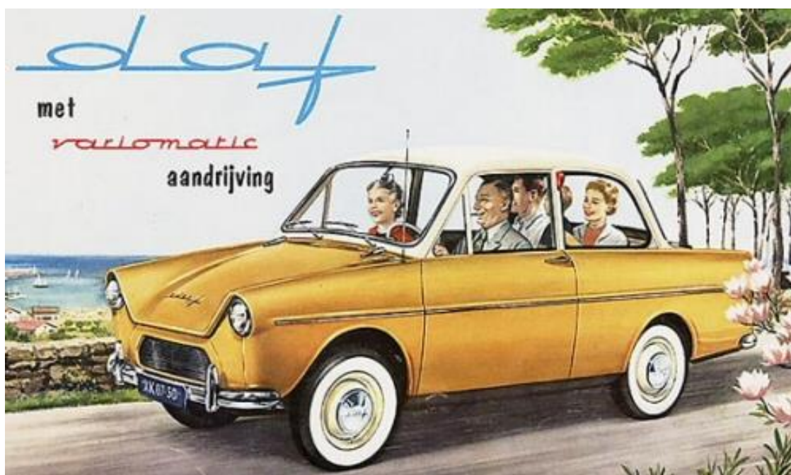
Hier opa (met sigaar) met oma en enkele kinderen in de Daf 44