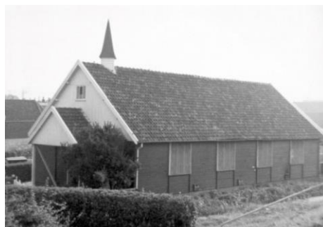
Dijklaankerk te Vlaardingen (In de jaren tachtig gesloopt)

Vrijwel direct als de kinderen uit de zondagschool kwamen werd een warme maaltijd gebruikt.