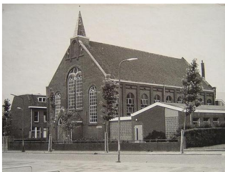
Westnieuwlandkerk Vlaardingen (gesloopt in 1975)

In begin jaren vijftig van de vorige eeuw gingen opa en oma naar de Westnieuwlandkerk in Vlaardingen. Daarna tot de jaren zestig in de Dijklaankerk te Vlaardingen.