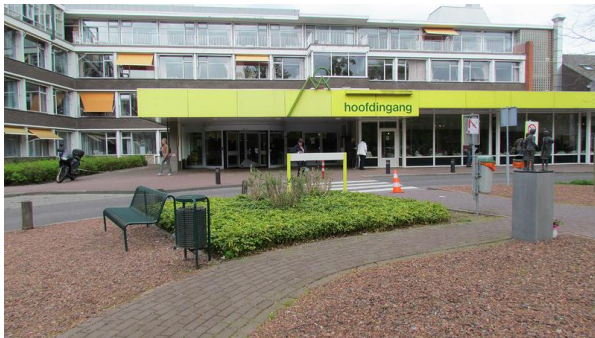
Medisch centrum Alkmaar