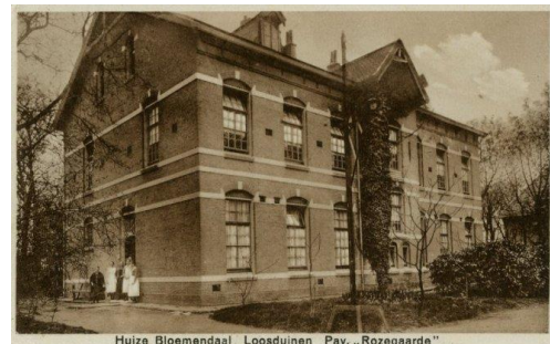
Huize Bloemendaal Loosduinen Pav. „Rozegaarde” Paviljoen Rozegaarde Psych. inr. Bloemendaal