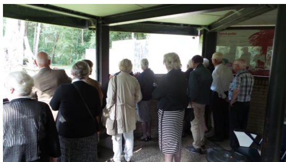
Even aapjes kijken hoort daar ook bij.