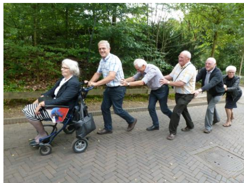
Alle gekken op een rijtje.