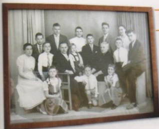
25 jaar getrouwd, alle 14 kinderen staan erop