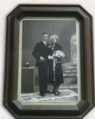
Trouwfoto (6 juni 1934)

Dat ging wel om 1 miljoen gulden! Nu kunnen we ons dat niet meer voorstellen, een auto met chauffeur en geen beveiliging. Maar toen dacht je er niet bij na, het was gewoon je werk', vertelt Van der Slikke die later tot zijn pensionering op de afdeling personeelszaken werkte en bij deze werkgever zijn vrouw ontmoette. 'De 50 jaar heb ik net niet gehaald, want in mei werd ik 65 jaar en in december zou het 50-jarig jubileum zijn'.