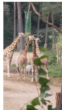
Daarna een rondje "Burger Zoo".