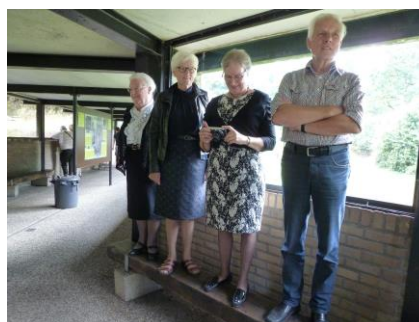
Mogen wij ook wat zien!