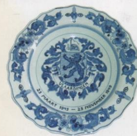
Levers' Zeep Maatschappij. De fabriek werd gebombardeerd op 23 maart 1945 en op 25 november 1949 weer in gebruikgenomen

tot op de draad versleten en mijn vrouw zei tijdens de zwangerschap: 'Er is een God in de hemel die alles weet. Hij weet dat er een kind geboren wordt en wat het kind nodig heeft. Daar houd ik mij aan vast.' En dan te bedenken dat ze pas tijdens ons huwelijk is gaan geloven, nadat ze een bekeringservaring heeft gehad. Ze vertrouwde op de Heere. In onze kerk was een mevrouw die een miskraam kreeg en hoorde dat ze geen kinderen meer kon krijgen. Ze wist dat mijn vrouw in verwachting was en dringend een babyuitzet nodig had. Ze kwam langs en schonk ons alles wat we nodig hadden. Het waren zulke mooie spullen, onze zoon lag er prachtig bij. Maar het mooiste was de wonderlijke uitkomst van de Heere'.