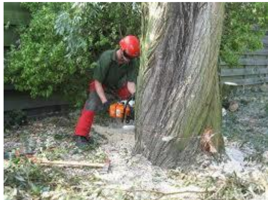
Uiteindelijk heeft mijn zoon de boom omgezaagd.

Maar goed om een lang verhaal kort te houden, U begrijpt dat het perkje zonder die boom door mijn deskundig hovenierswerk tot een juweeltje omgetoverd werd. Dus als U een tuin heeft en U wilt er een lusthof van maken, bel gerust.