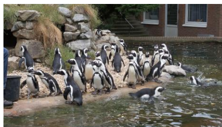
Ten slotte nog even langs de pinguïns