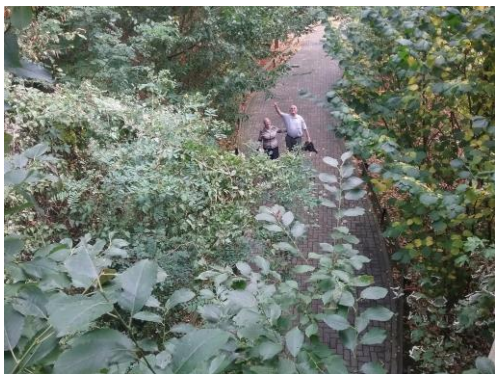
Hé, wie lopen daar? Is dit familie van ons?