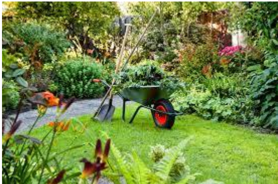
Ik kan heel goed hovenieren!

Ik heb de moed opgegeven en mijn oudste zoon gesmeekt om in zijn vakantie te helpen. Hij heeft geen hoogtevrees begrijpt U en bovendien daar is toch een schoolvakantie voor, wat moet je anders doen in de herfstvakantie?