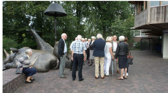
Daarna gingen we naar | "Burger Zoo" te Arnhem.