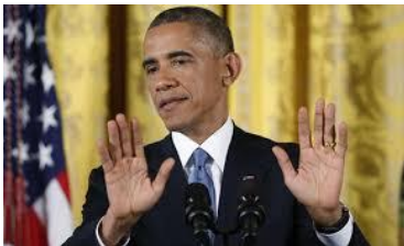
Van mij hoeft het niet!

Nee, geef mij maar een mannentoilet en een vrouwentoilet. In een mannentoilet zijn ook vaak, hoe zal ik dat zeggen, van die muurbakken waar je boven kunt hangen. Dat gaat veel sneller. Dan hoeft je niet je broek te laten zakken. Daarom staan er in een mannentoilet ook nooit rijen. Die kerels zijn zo klaar. Laatst stond bij de Hema een hele rij vrouwen voor het toilet en ik kon zo doorlopen. Heerlijk toch!