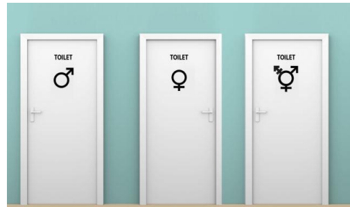
“Elck wat wils”

Ik ben tegen en als protest ga ik thuis beneden naar het toilet en mijn vrouw boven. Dat heeft ook een medische reden, maar daar hebben we het nou niet over. Mijn zus trouwens doet hetzelfde. De visite gaat beneden naar het toilet en zij gaat naar boven. Ik denk dat zij ook tegen is.