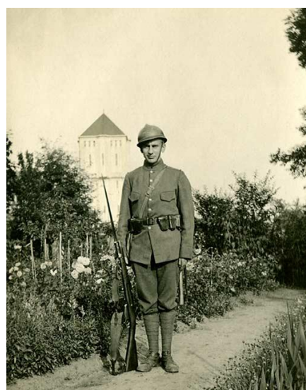
Hollandse soldaat ca.1930

Dit is de ene laatste foto van de maand. Wie presenteert in de laatste nieuwsbrief zijn of haar foto van de maand. Wij zijn benieuwd.